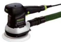
ETS 150/5 电动偏心振动磨机