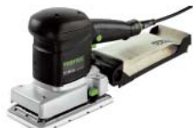
RS 300 EQ-PLUS 方形振动磨机