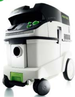
CTL 36 E 工业集尘器