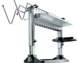
WCR 1000 工作中心